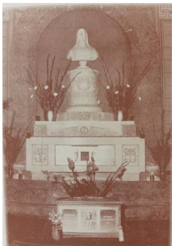
Verona: monumento sepolcrale del Provolo nella cappella attigua alla chiesa di Santa Maria del Pianto.