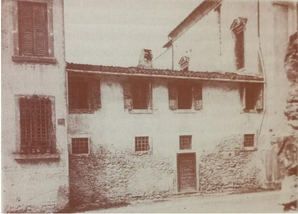
Una delle casette Albertini dove, il 27 gennaio 1832, si trasferì il Provolo e dove ebbe inizio il suo Istituto per sordomuti

Signore", ed aperta anche ad altre opere caritative, soprattutto nei confronti dei giovani bisognosi di istruzione e di educazione morale e del popolo bisognoso di sentire l'amore di Dio nel proprio cuore.