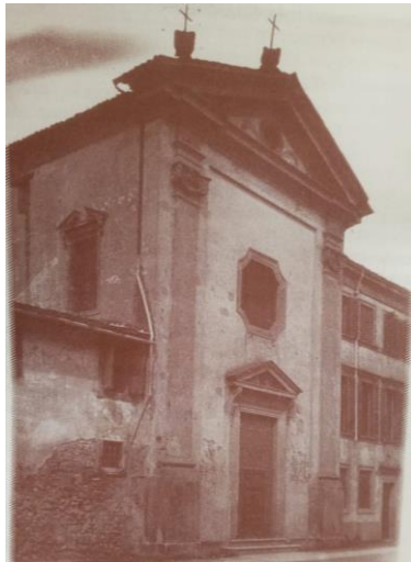
Chiesa di S. Maria del Pianto che il Provolo e i suoi compagni ristrutturarono. Fu ribenedetta e riaperta al culto nel 1836.

E a suon di fatiche di sacrifici si riesce a restaurare anche la piccola chiesa, presso la quale, per invito del Parroco di San Zeno, viene aperto l'Oratorio per i fanciulli della parrocchia.