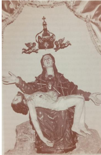
Verona: La Pietà in Santa Maria del Pianto.

Scrive il Provolo: "Gesù è morto e riposa sulle spalle e tra le braccia di Maria sua Madre... Già ella lo stringe addolorata al seno, già siede sopra un duro sasso, lo adora, lo abbraccia, lo bacia...". Solo la delicatezza del "bel cuore" del Provolo può cogliere il dolore e l'amore materno! Più intenso è l'amore e più profondo è il dolore: l'Addolorata, mamma per eccellenza, Colei che per amore ha pronunciato il suo fiat, è il simbolo anche del dolore ai piedi della Croce.