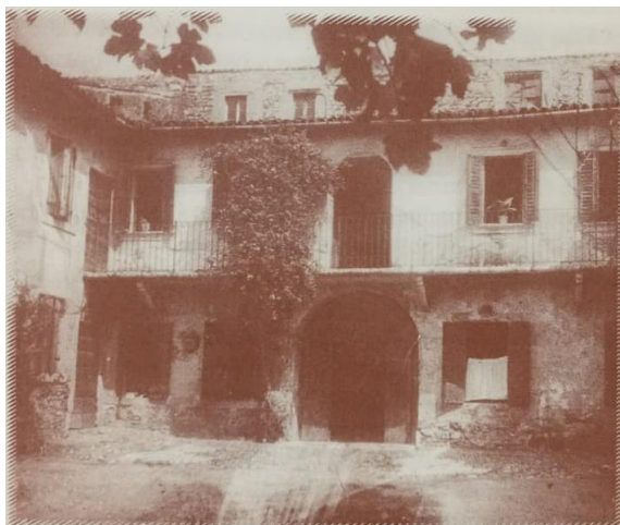
Particolare del cortile interno dell'Istituto femminile (situato di fronte all'Istituto maschile) dopo il trasferimento dalla casa di proprietà della contessa Giuliani.

Difficoltà e contrarietà non mancano neppure per piantare questa pianticella nuova: ma, alla fine, tutto si risolve. La prima sede del nuovo Istituto della Comunità femminile viene trovata in vicolo Pero, nella parrocchia di San Luca. In tale sede, il 9 ottobre 1841, solennità della Maternità di Maria, ha inizio ufficialmente il piccolo Istituto.