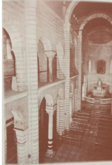
Veduta interna della chiesa di S. Lorenzo dove il Provolo esercitò il suo primo, fecondo apostolato.

Anche dopo il sacerdozio egli continua questo fervido apostolato nella chiesa di San Lorenzo, una chiesa alla quale è particolarmente affezionato: qui egli celebra la sua prima Messa nel giorno di Santo Stefano del 1824, qui si dedica, novello sacerdote, al servizio delle anime come confessore e predicatore, rivolto soprattutto ai giovani. Questa storica chiesetta nel cuore di Verona fu per lui come una seconda casa, un habitat ideale di preparazione verso un apostolato al quale, con il tempo, la Provvidenza lo avrebbe chiamato.